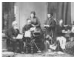
Interior Casa Mănăstirii Brașov

Mit freundlicher Unterstützung : Și se desfășoară cu sprijinul: