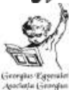
George Enescu Asociația George Enescu